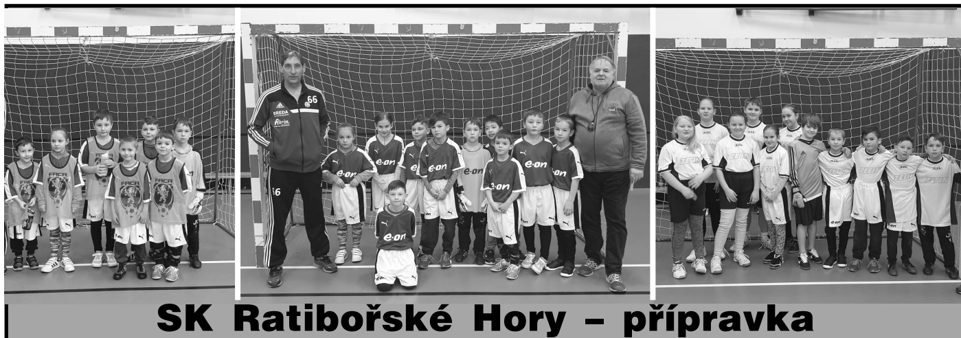
SK Ratibořské Hory – přípravka