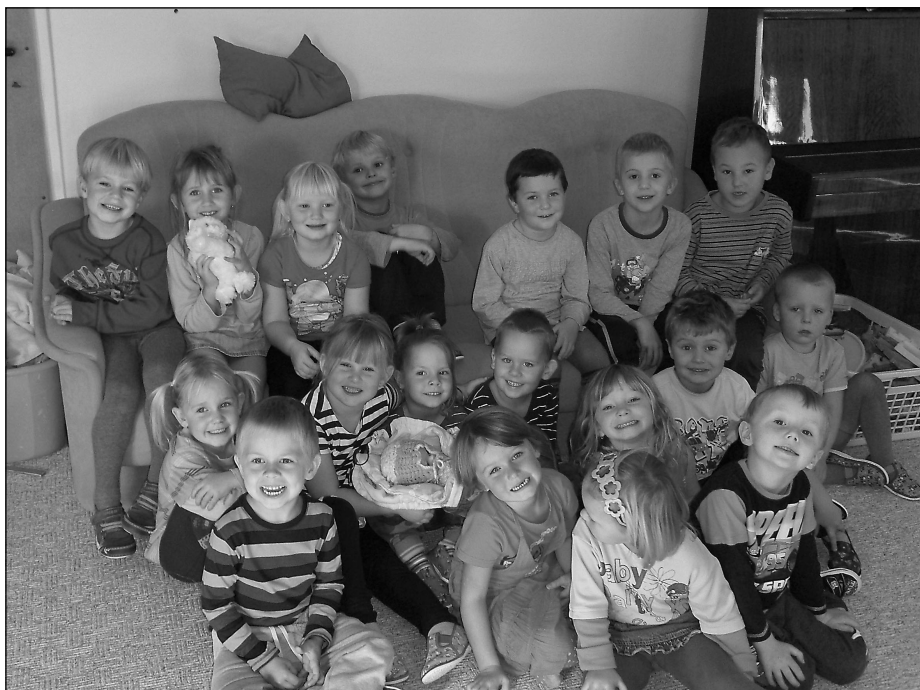
Děti v „nové školce“