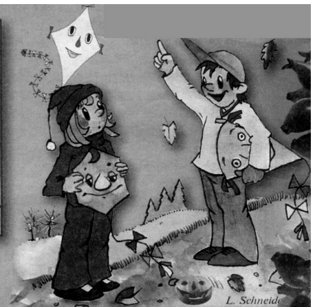
Viděla jsi to? Tady letěl čap do teplých krajín a ptal se mě... (tajenka)