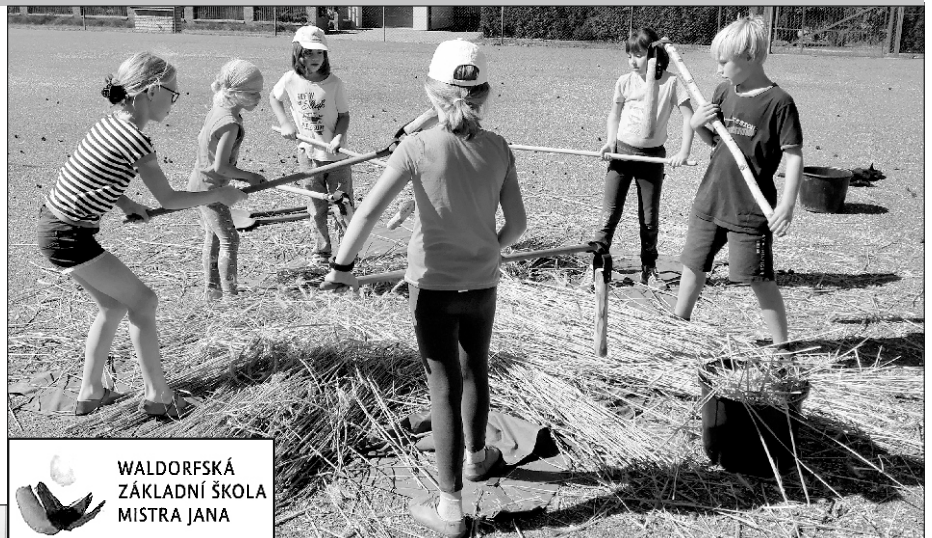
WALDORFSKÁ ZÁKLADNÍ ŠKOLA MISTRA JANA

V září se děti vrátily do lavic k denní výuce. Intenzivně se snažíme doplnit s dětmi látku, která byla poznamenána distanční formou vyučování. Velký prostor jsme rovněž počátkem školního roku věnovali socializaci žáků a ošetření vztahů ve třídách. Čtvrté třídě se podařilo v rámci epochy „Ze zrna chléb“ sklídit obilí, vymlátit jej z klasů, namlít na mouku a napéct chleby, o které se na zářijové měsíční slavnosti podělila se zbytkem školy. Třetí třída již obilí na příští rok zasela.