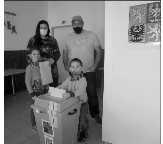
Bejdlovi z Ratibořských Hor u voleb