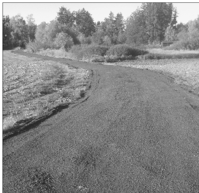
Obnova cesty k lomu