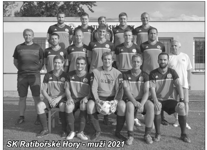
SK Ratibořské Hory - muži 2021