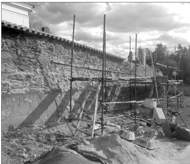
Oprava ohradní hřbitovní zdi v Ratibořicích