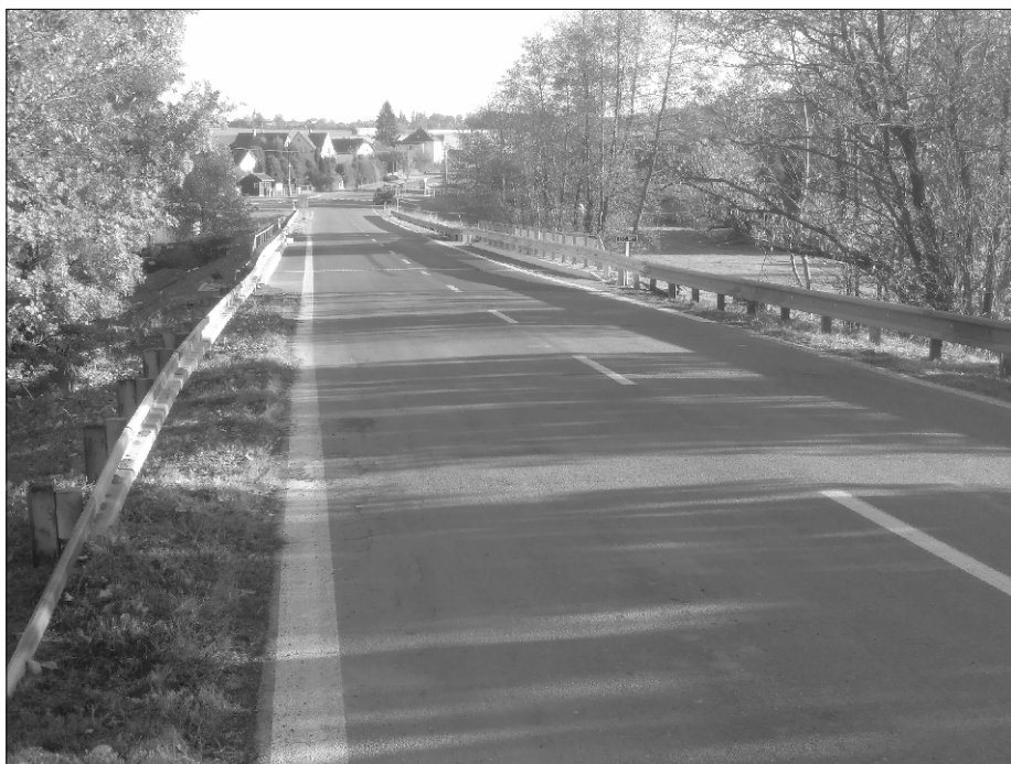
Nový most ve Vřescích