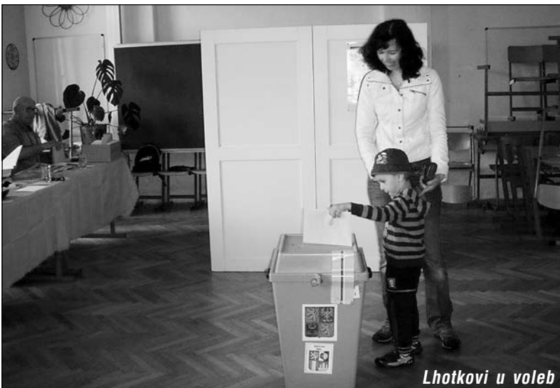
Lhotkovi u voleb

Poslední červnová sobota patřila již druhým rokem DubFestíku, přehlídce Country a Bluegrassových supin. Letošní ročník se vyvedl jak počásm, tak i skladbou vystupujících skupin, kdy jsme mohli přivítat i přední bluegrassovou skupinu Blanket Praha, která hraje již od roku 1985. Svě muzikantské umění nám předvedli i Kvintet Písek, Čtyřválec Dixie, Žíznivej Slim a skoro místní Krýgl Boys. O příjemné zpestření se svým vystoupením postaraly Sestry Šavrdky a ani letos nechyběla výuka country tanců pod vedením taneční skupiny Čtverylka z Tábora. Velké poděkování za organizaci celého festivalu patří občanskému sdružení „Život v Dubu“, které vás tímto zve na další ročník DubFestíku, opět za rok poslední červnovou sobotu.